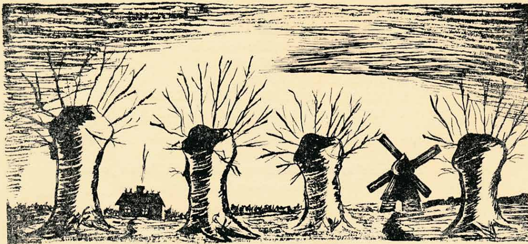
Vår över slätten.